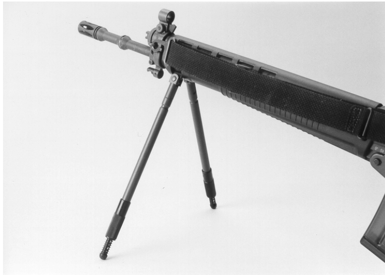
Figure 3 : Bipied réglable destiné au F ass 90, modèle SIG

Ce bipied SIG peut être réglé sans palier de 250 à 345 mm ce qui permet d'adapter la ligne de mire à toutes les tailles.