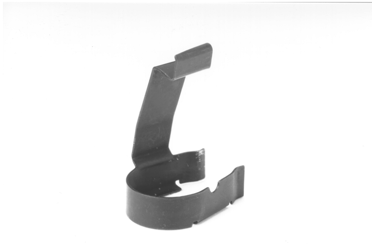
Figure 6 : Etrier de dioptre pour F ass 57, modèle Furter

Cet étrier de dioptre peut aussi bien être monté, sur le dioptre d'ordonnance non modifié qu'en relation avec un iris ou une rondelle perforée.