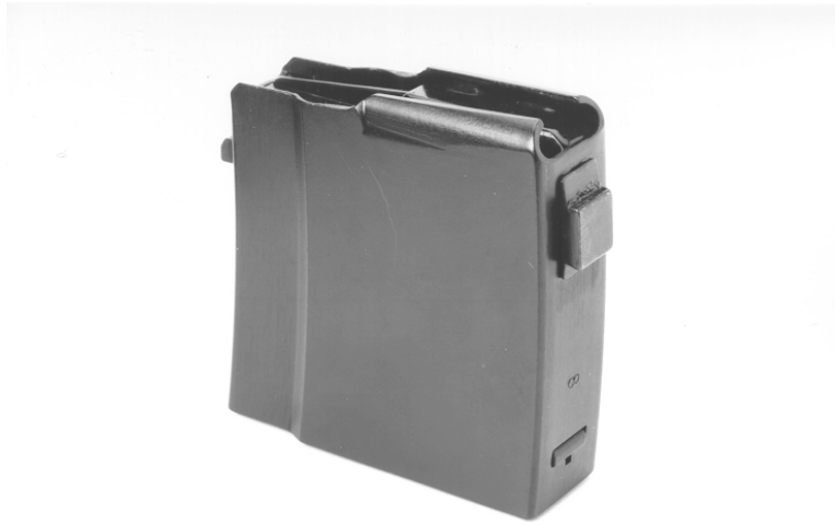
Figure 7 : Magasin court pour F ass 57, modèle W+F

Le magasin court à 6 coups est uniquement autorisé pour le tir «à genou».