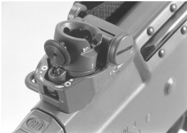
Figure 2 : Iris pour F ass 90, modèle Furter

Les deux diaphragmes sont complémentaires et sont livrés ensemble.