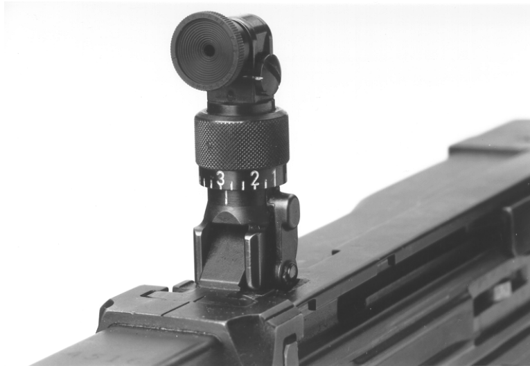
Figure 4 : Iris pour F ass 57, modèle Grünig et Elmiger

3 Le diamètre de l'anneau de réglage de l'iris peut être de 13 mm ou de 17 mm (selon la version).