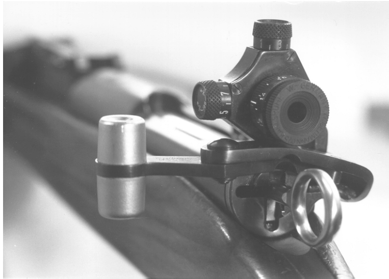
Figure 9 : Verrou à gauche pour mousqueton 31, avec dioptre modèle Bürgin

1 Verrou à gauche pour mousqueton 31, modèle Bürgin (Autorisations du 30 août 1949 et du 28 février 1980)