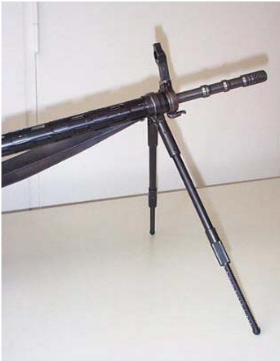
Figure 8 : Bipied réglable destiné au F ass 57, modèle Hämmerli SA