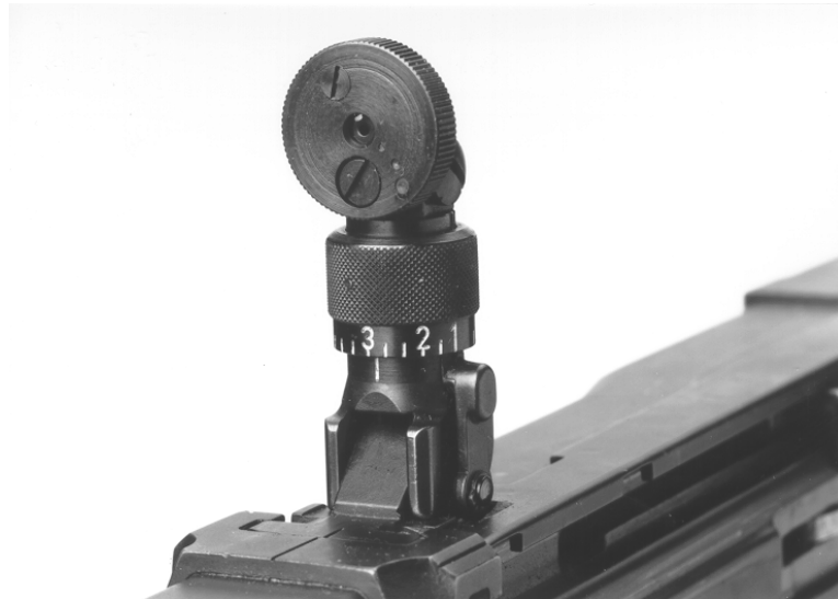
Figure 5 : Rondelle perforée pour F ass 57, modèle Furter

2 L'écart entre l'orifice de visée et l'axe du dioptré est de 9,5 mm.