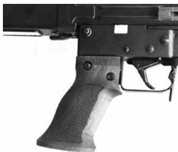
Figure 13: Poignée de pistolet Tactical pour F ass 57