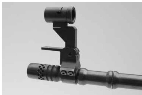
Figure 10: Bloc guidon comme rallonge de hausse (montage sur canon), produits divers