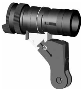
Figure 9: Bloc guidon universel pour F ass 57 (montage normal), produits divers