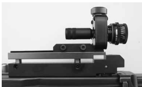
Figure 12: Porte dioptre pour F ass 57 pour le montage de dioptrés (à l'épreuve des tirs), produits divers