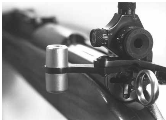
Figure 19: Verrou à gauche pour mousqueton 31