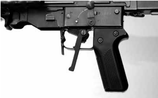
Figure 17: Détente d'hiver pour tireurs gauchers pour F ass 57

Le montage doit impérativement être effectué par le commerce spécialisé.