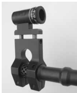
Figure 11: Bloc guidon comme rallonge de hausse (montage sur la bouche à feu), produits divers