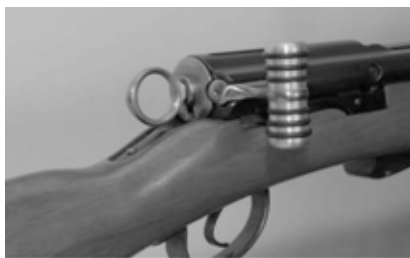
Figure 21: Poignée de verrou anatomique pour mousqueton et fusil