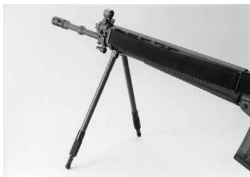
Figure 2: Bipieds réglables pour F ass 90, produits divers