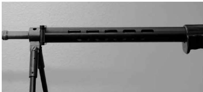
Figure 16: Manchon pour F ass 57