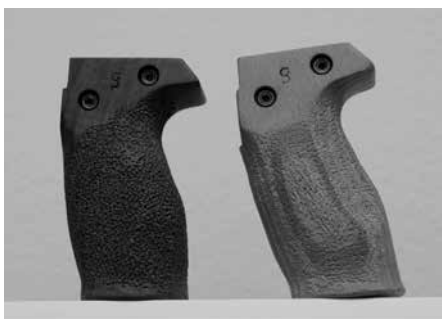
Figure 14: Poignées standard 021101 et 021102 pour F ass 57