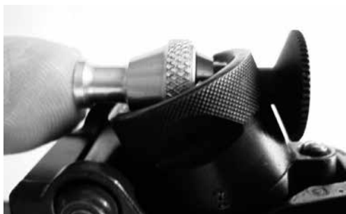
Figure 5: Système de filtres colorés Wyss emboîté