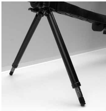
Figure 7: Bipied réglable pour F ass 57, produits divers