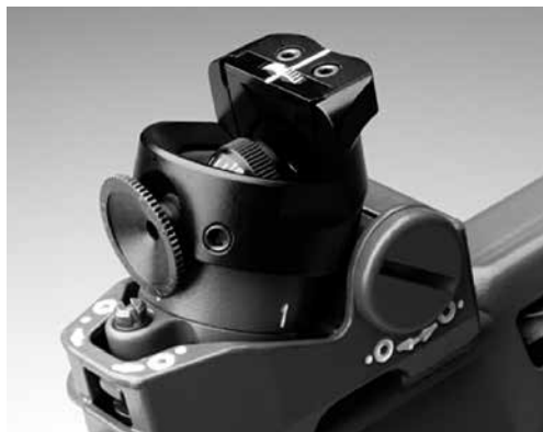
Figure 4: Filtres colorés excentriques avec cassette coulissante, modèle Grünig & Elmiger; modèle Wyss semblable