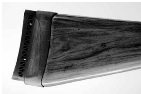
Figure 20: Sabot de crosse 50 mm pour mousqueton 31

5.5 Sabot de crosse pour mousqueton et fusil 01.01.2013/ Le montage du sabot de crosse 15 mm, 30 mm et 50 mm de l'entreprise Wyss est autorisé pour le mousqueton et le fusil. 01.01.2014