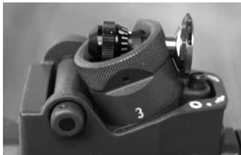
Figure 3: Iris pour F ass 90 (avec et sans filtres), produits divers