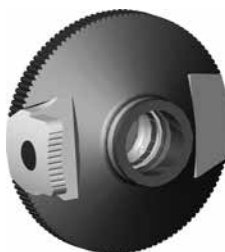
Figure 6: Rondelle pour filtres colorés pour iris, produits divers