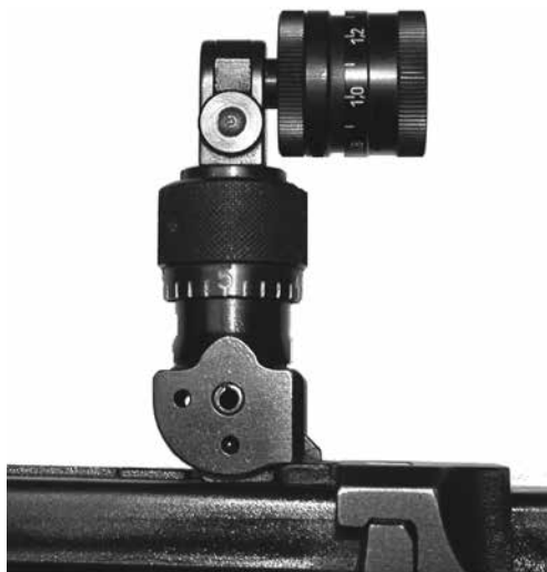
Figure 8: Iris pour F ass 57 (avec ou sans filtres colorés ou de polarisation), produits divers

Toutes les rondelles perforées et tout les iris non modifiés, disponibles dans le commerce spécialisé avec ou sans filtres colorés ou de polarisation et pouvant être montés sur le dioptre d'ordonnance non modifié, sont autorisés. 01.01.2011